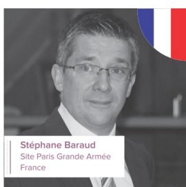
Stéphane Baraud Site Paris Grande Armée France