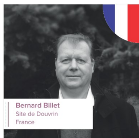
Bernard Billet Site de Douvrin France