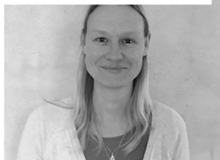
Création d'une école Handi-basket

Le projet consiste en la création d'une école de handi-basket. Le but est d'étendre la pratique du handi-basket aux jeunes de 11 à 18 ans et éventuellement de les former à une pratique compétitive de haut niveau. Dans le cadre du développement de ce projet, le soutien de la Fondation PSA contribuerait à l'acquisition de fauteuils roulants mis à disposition par le club pour la pratique du handi-basket.