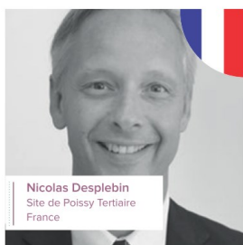
Nicolas Desplebin Site de Poissy Tertiaire France